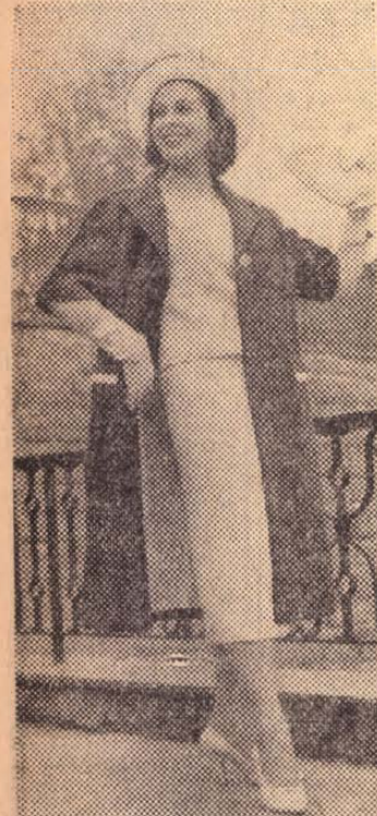
A berlini Ruházati Kultúrintézet dívatbemutatója. »Tavaszi szellő« komplé, fehér-kék színben. A háromnegyedes kékkabát dívatosan egészíti ki a fehér kosztümöt. Figyelemre méltó a kabátújj megoldása

Ma még nem a legkényelmesebb körülmények között dolgoznak, tanulnak a látogatók, még csak egy kis olvasótermet lehetett megnyitni. A KÖZELBIZ azonban május 15-ével kiutalta a Molnár utca 11. számú házban azokat a könyvtár céljaira alkalmas helyiségeket, amelyeket a könyvtár dolgozói kértek. Itt