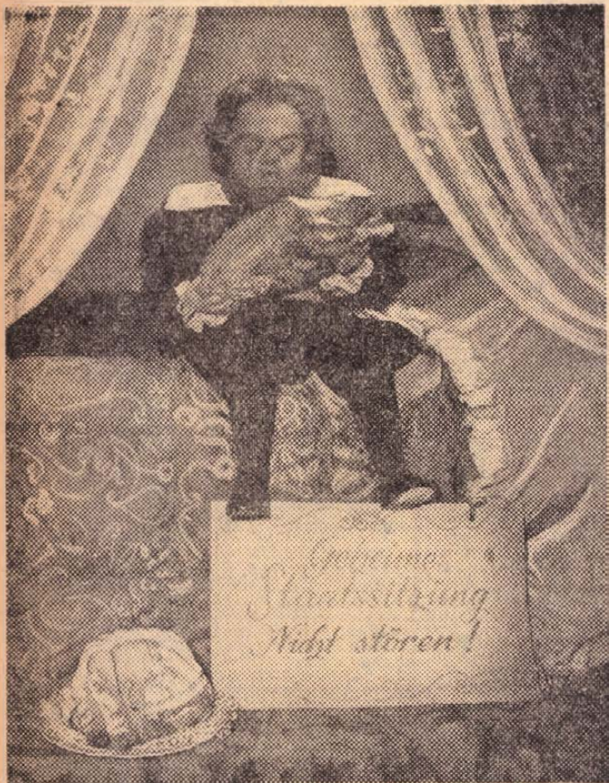
A világ legkisebb színésze, a 40 éves Werner Krüger: 93 centiméter magas. A képen Krüger a »Felkelés Lubbarland« című gyermekfilm forgatása közben