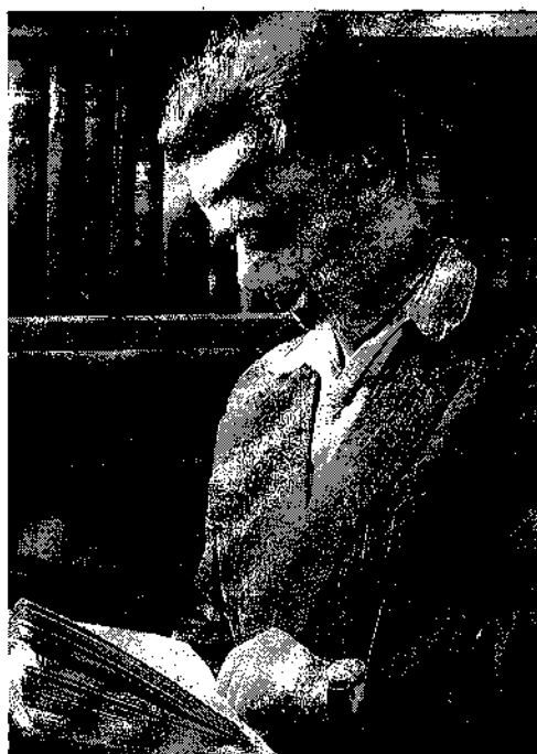
A régi szép időkben...

– Úgy van. November 5-én megindult volna a munka. Azok, akik valóban forradalmat csináltak, maguk vállalták, hogy az ellenőrizhetetlen, szélsőjobboldali anarchisztikus kalandor jellegű csoportok ellen akcióba lépnek, ha ez szükséges. Úgy látszott, a kormánynak kellő karhatalma volt már, és akkor jött a beavatkozás.