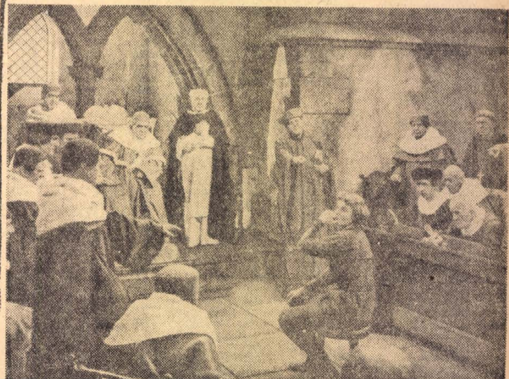
INGRID BERGMAN, a világhírű svéd származású filmszínésznő játssza a már több ízben megfilmesített »Szent Johanna« egyik új, színes filmváltozatának főszerepét