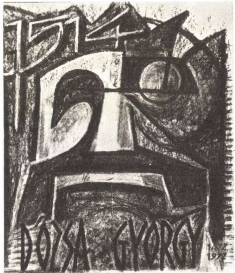
PROHÁSZKA ANTAL: Dózsa