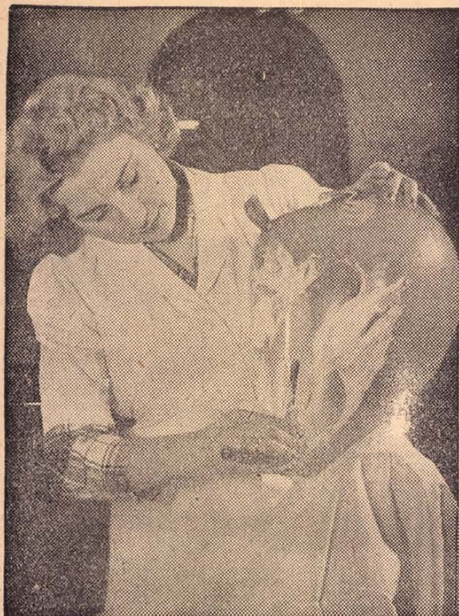
BOROTVAÉLEN TÁNCOL A HELYZET a csinos fodrász-tanoncok kezétől. Nyugat-Németországban ugyanis új módszerrel, léggömbökön tanítják a beretválás nehéz mesterségét. Ha a tanonc egy rossz mozdulatot tesz, elpattan a léggömb és a fodrászművészet rejtelmeibe behatolni kívánó tanulóknak meg kell birkózniuk az arcukba csapódó szappanhabfelhőkkel.