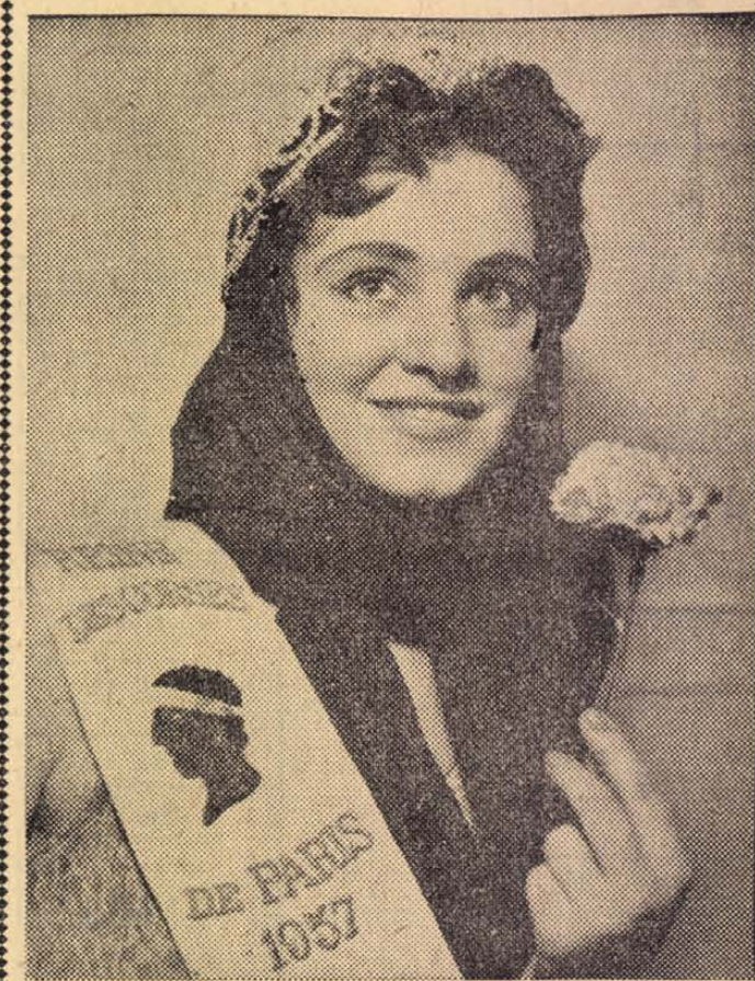
KORZIKA RÓZSÁJA . Szépségkirálynőt választották a Párizsban élő korzikaik. A kép azt bizonyítja, nem esett méltatlanra a választásuk

Az ország egész területén ismét rendszeresen megtartják az országos kirakodó- és állatvásárokat. Február hónapban még a következő helye-